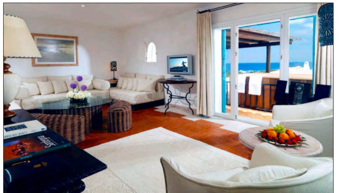
Klare Aussicht: ein neues Hotel aus Starwoods Luxury Collection, an Sardinien's Costa Smeralda. Matthias Hamel

Die jüngste Halbjahr-Hotelstudie der Hogg Robinson Group (HRG) zeigt ebenfalls, dass sich der internationale Hotelmarkt auch unter schwierigen Wirtschaftsbedingungen als belastbar erweist, und dass in den meisten Regionen noch Preis-Steigerungen verzeichnet werden. Eine Trendentwicklung im Fokus des internationalen Geschäftsreise-Dienstleisters HRG ist die Nachfrage in den beiden Schweizer Business-Destinationen Zürich und Genf. Sie hat deutlich zugenommen. «Dementsprechend sind auch die Hotelpreise in diesen beiden Städten angestiegen», so Beat Bürer, Managing Director Europe Central von HRG. «Dies kann in erster Linie auf den stärkeren Euro zurückgeführt werden. Die Schweiz als Nicht-Euro-Land wurde im ersten Halbjahr 2008 für Meetings und Konferen-