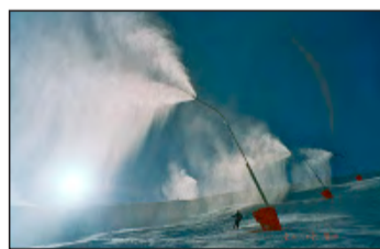
Mechanische Beschneuerung ist heute ein Muss.